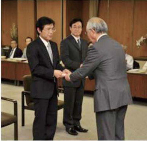
左: 田口准教授 中央: 飯田准教授