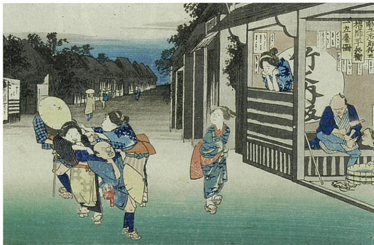
広重 東海道五拾三次之内 御油 旅人留女(保永堂版) 名古屋市博物館蔵

本展では、旅の雰囲気を生み出すための広重の工夫に注目し、当時の人々が作品から感じたであろう旅の気分を追体験してみようと思います。