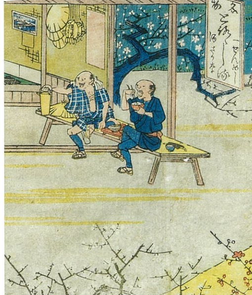
上段左: 広重 東海道五拾三次之内 四日市 三重川(保永堂版) 右: 広重 東海道五拾三次之内 日本橋 朝之景(保永堂版) 中段: 広重 東海道五拾三次之内 由井 薩摩嶺(保永堂版) いづれも名古屋博物館蔵 下段左: 広重 木曾海道六拾九次之内 本山 徳川美術館蔵 右: 広重 東海道五十三次之内 駒子(行書版) メーテレ蔵