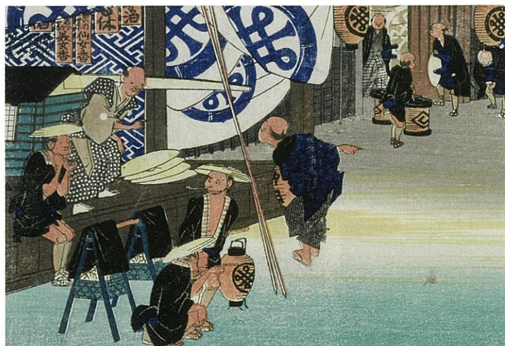
広重 東海道五拾三次之内 関 本陣早立(保永堂版) 名古屋市博物館蔵