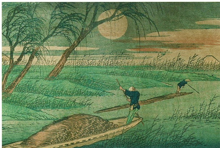
広重 木曾海道六拾九次之内 洗馬 徳川美術館蔵 (※作品画像は表裏ともすべて部分図)