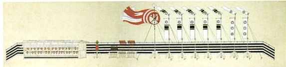
徳川直七節供旗飾り (展示期間:2月5日~3月4日)