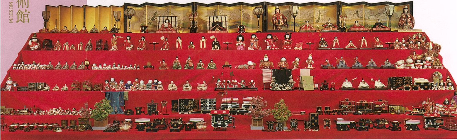
尾張徳川家3世代の雛段飾り