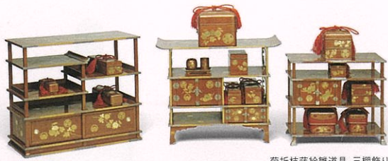
菊折枝時絵雛道具 三棚飾り