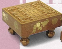
菊折枝時絵雛道具 符拱盤