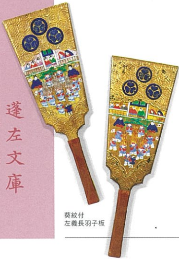
葵紋付 左義長羽子板

毎年一定の時に繰り返される年中行事は、季節の移ろいの中で人々の生活に欠かすことのできない文化・慣例として受け継がれてきました。年中行事には、上巳の節供 じょうし (雛まつり)など、現在の文化に色濃く引き継がれている行事もあれば、今では我々の生活から縁遠くなってしまった行事、あるいは変容して息づく行事などもあります。